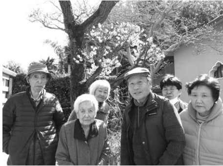
安養寺には、色とりどりの梅が咲き誇っていました。