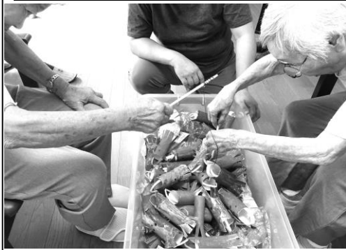
↑タコ釣り ↓ヨーヨー釣り

輪投げでは、目標の棒に景品を付けて、入ったらその景品をもらえるようにしました。ただし、何個も入った人はそのうち一つ、好きな物を選んで持ち帰っていただきました。また、タコ釣りゲームは