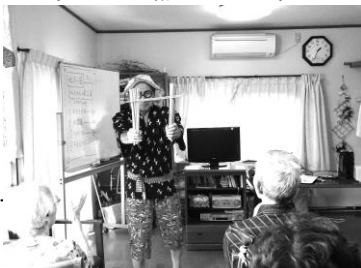
上:南京玉すだれ 下:民謡踊り