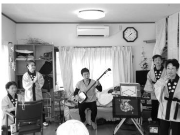
上:南京玉すだれ 下:民謡踊り