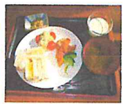
↑サンドイッチは年に数回です