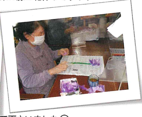
↑大正生まれの方も参加して下さいました😊