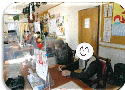
👉ビンゴ大会とサイコロトーク

一番幸せだった事；いちよう並木ドライブに連れて行ってもらって紅葉を見られたこと。等トークがありました。