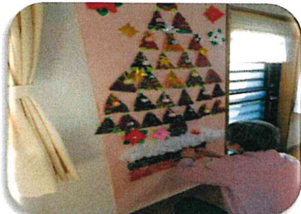
👉大きなツリーを皆さんで作成しました～