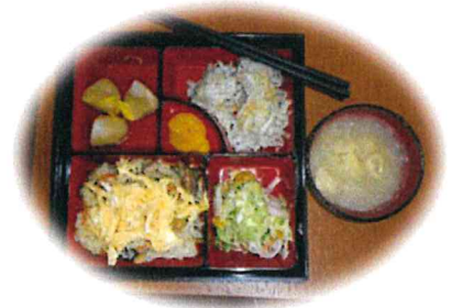
☺お楽しみメニュー 炊き込みご飯 里芋の柚子味噌 花シューマイ サラダ 漬物