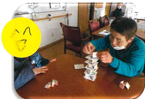
☺鶴亀積み上げゲームです。