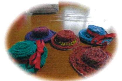
☺1月の作品；帽子のブローチ