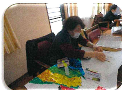
☺1月のカレンダー作りです。