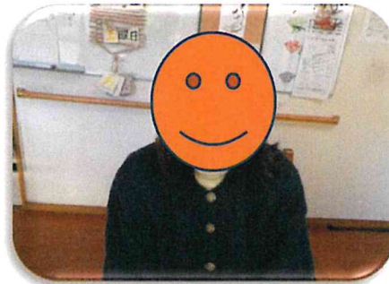
☺I.R様（1月〇日産まれ） リクエストのオムライス等 をご提供致しました。 コメント；「べつにね、、、