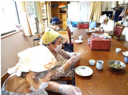
みんなで『餃子』づくり

昼食は、病状などに配慮したそれぞれの利用者の方々にあった 食事やおやつを提供します。